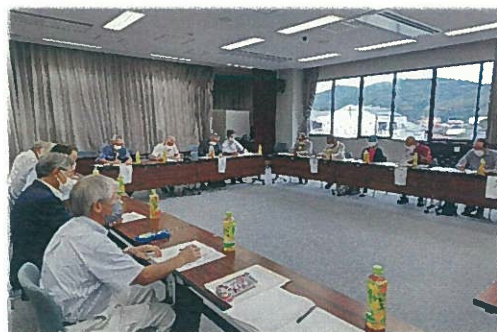
意見交換会(奥出雲町)

皆様のお話を聞く中で、広域協定内の各集落間の予算配分や工事の優先順位の付け方、各集落や参 加団体との調整を担うコーディネーターの役割や、事業推進、事務処理のための拠点（事務所）づく り等、広域協定毎に工夫されていることが分かりました。