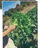
10月末には水菜を収穫しました