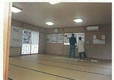
環境フェア展示会場