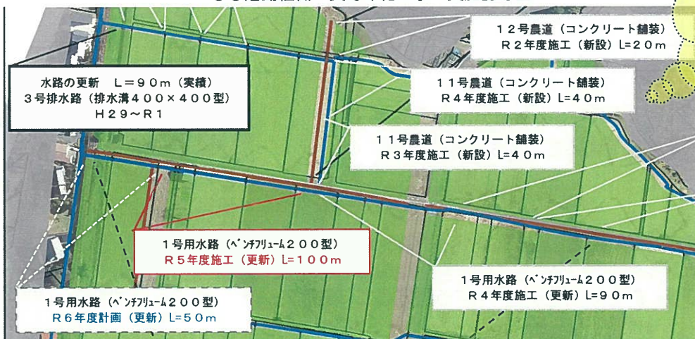
〇〇活動組織 長寿命化工事 実施記録図

5年間の1活動期間だけを記録するのではなく、それ以前の活動記録も残しておきましょう！