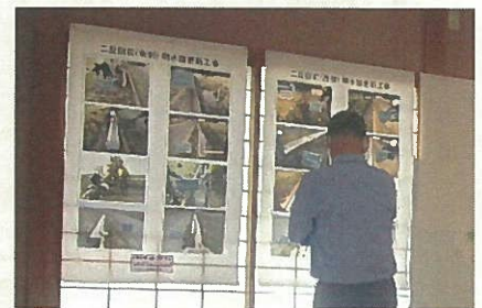
環境フェア展示状況