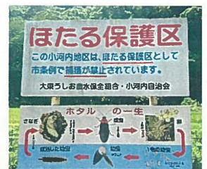
大東うしお農水保全組合 (雲南市)