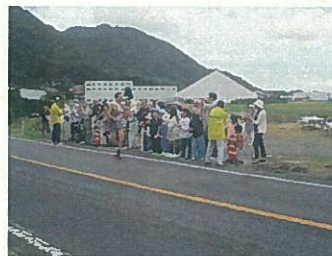
出雲駅伝応援風景