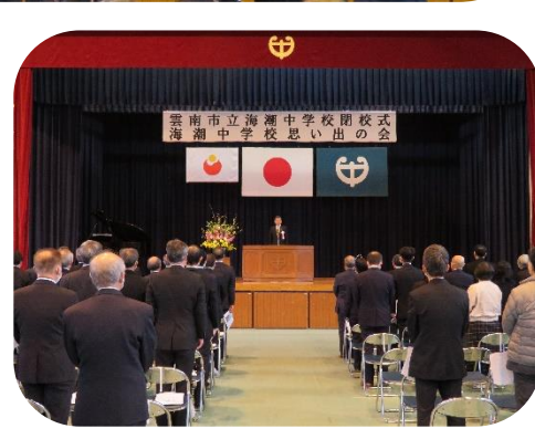
会場全体で海潮中学校校歌、生徒の歌を合唱