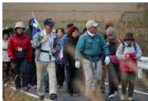
昨年のウォーキング例会より